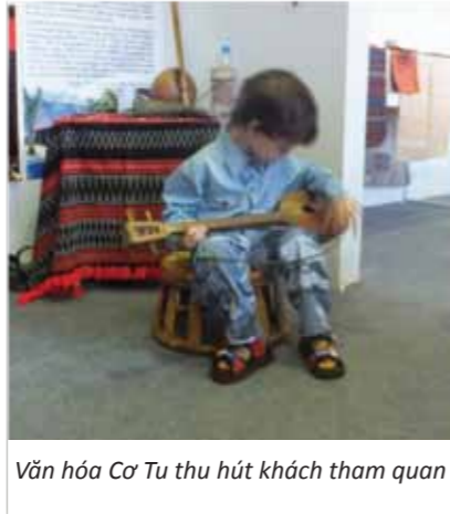
Văn hóa Cơ Tu thu hút khách tham quan