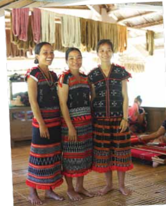
Trang phục truyền thống với cách phối màu đen, đỏ và trang trí cườm trắng