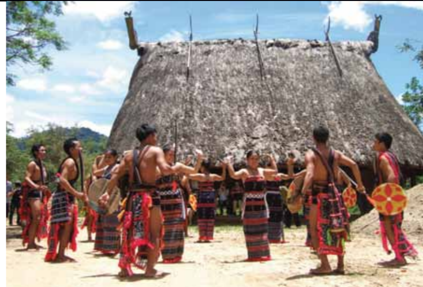
TUNG TUNG YA YA - ĐIỀU MÚA TRUYỀN THỐNG CƠ TU

Brú Thương, Điều phối viên Tour Du lịch dựa vào cộng đồng Cơ Tu