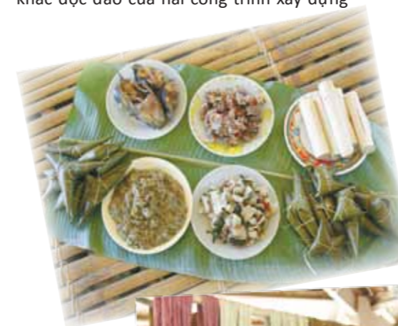
Món ăn Cơ Tu với các nguyên liệu từ rừng

Qua đợt làm việc với Tiến sĩ Hùng, bà con Cơ Tu như được khơi lại vốn văn hóa quý giá của mình. Họ cảm thấy rất tự hào khi sở hữu một nền văn hóa độc đáo, được đánh giá cao bởi du khách và người ngoài. Đồng thời nó nhắc nhở họ về ý thức bảo tồn nền văn hóa đậm đà bản sắc dân tộc và là động lực để họ chủ động trong việc bảo tồn văn hóa về sau.