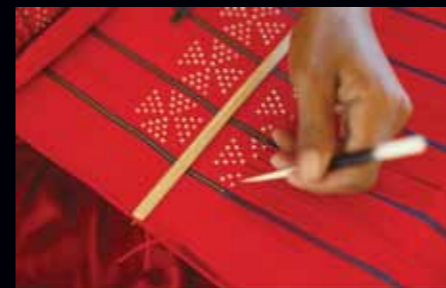
Dệt cườm độc đáo

Từ tháng 7/2012 đến tháng 12/2013: 21 đoàn, với khoảng 300 du khách đã tham gia các tour thử nghiệm. Du khách chủ yếu là người Nhật, Pháp, Úc và Việt Nam. Tất cả du khách đều rất thích thú khi được trải nghiệm văn hóa Cơ Tu và giao lưu với người dân địa phương.